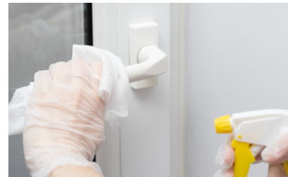
アルコールで事前に消毒