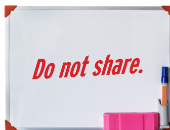
小備品の共有不可