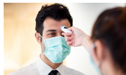
非接触型の体温計による検温