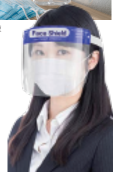
フェイスガード